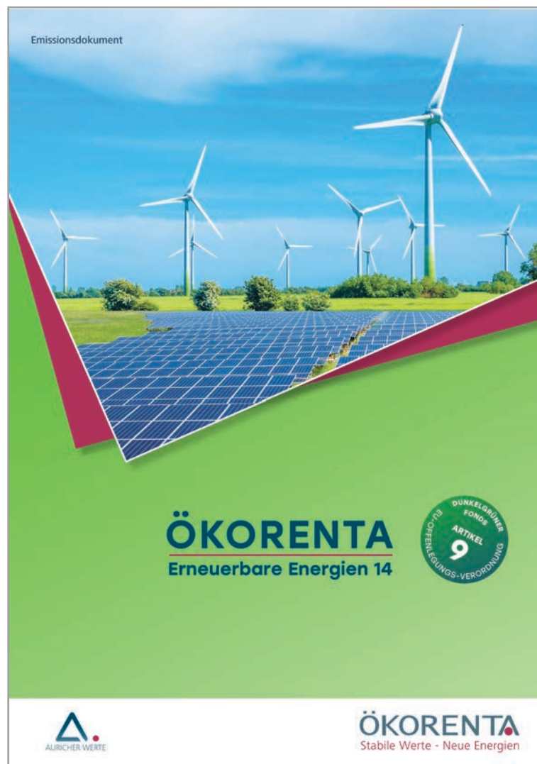
Abbildung: Titelseite der Kundenbrochure