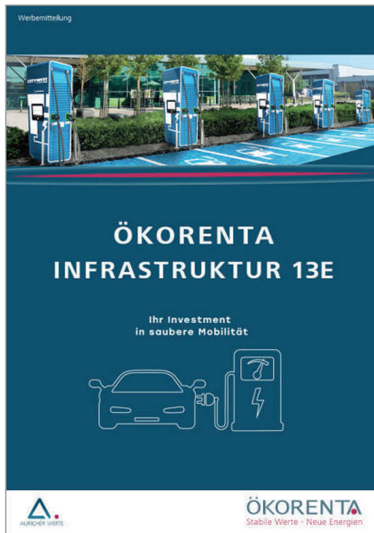
Abbildung: Titelseite der Kundenbrochure