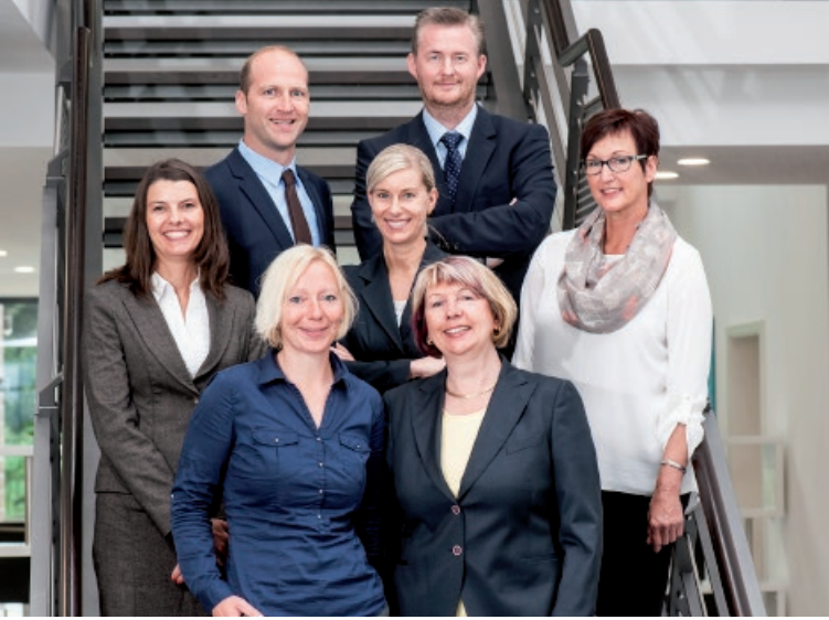
Vertriebs- und Marketingteam der ÖKORENTA